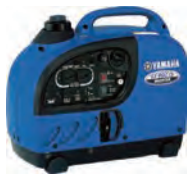
100V0.9KVA発電機 (インバータ・ガソリン)