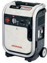
100V0.9KVA発電機 (インバータ・カセットガス)