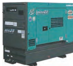
20KVAオイルフェンス一体発電機 (ビックタンク・軽油)