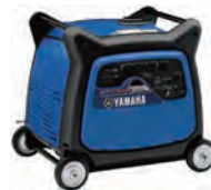
100V/200V(単相)5.5KVA発電機 (インバータ・ガソリン)