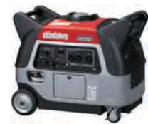
100V2.8KVA発電機 (インバータ・ガソリン)