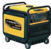
100V3.8KVA発電機 (インバータ・ガソリン)