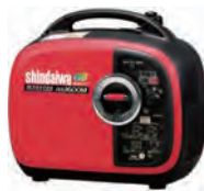
100V1.6KVA発電機 (インバータ・ガソリン)