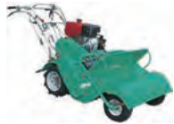
ハンマーナイフモア (刈幅800)