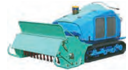
ハンマーナイフモア (刈幅1500)