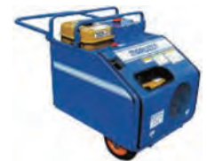
防音型エンジン 油圧ユニット