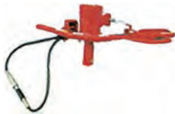
油圧ハンドオーガー