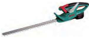
充電式ヘッジトリマー