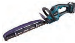
充電式ヘッジトリマー (片刃)