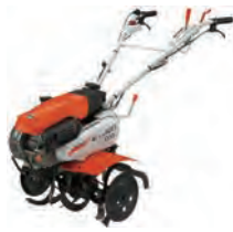
豆トラ (車軸タイプ)