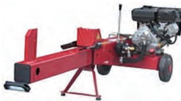
エンジン薪割り機