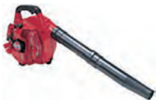
エンジンハンドブロワ