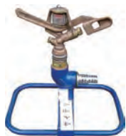
スプリンクラー（水道直結）