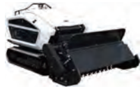
ハンマーナイフモア (刈幅1540)