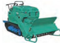
ハンマーナイフモア (刈幅1100)