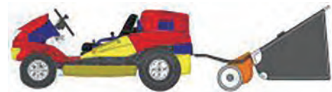
集草機 (草刈まさお用)