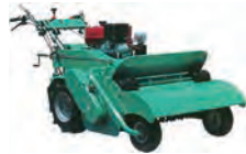
ハンマーナイフモア (刈幅950)