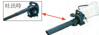
エンジンブロワ集塵機