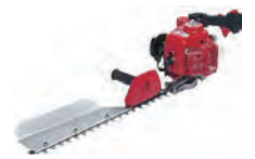
エンジンヘッジトリマー (片刃)