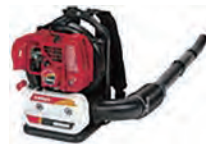
背負式エンジンブロワ