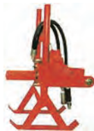
油圧横堀オーガー