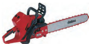
根切チェーンソー