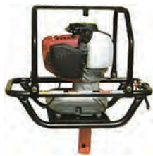
エンジンハンドオーガー