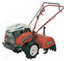
豆トラ (リヤロータリータイプ)