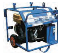
エンジン 油圧ユニット