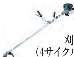
刈払機 (4サイクル・ガソリン)