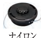
ナイロン カッター