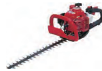
エンジンヘッジトリマー (両刃)