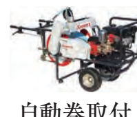
自動巻取付 動力噴霧機