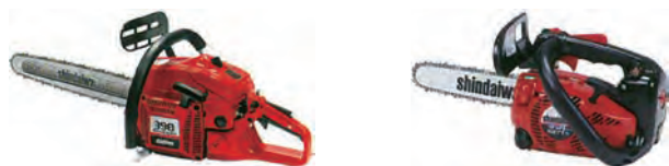
エンジンチェーンソー エンジンチェーンソー(小型)