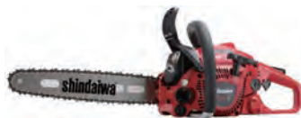
竹用チェーンソー