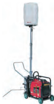
700Wバルーン投光機 (ガソリン)