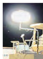
100V1000Wバルーンライト 作業車取付セット