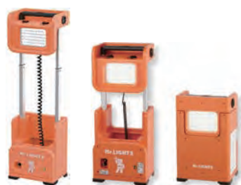
充電式LEDライト (ミスターライト)