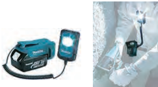
充電式LEDワークライト