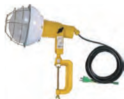
100V投光器 (白熱灯・水銀灯)