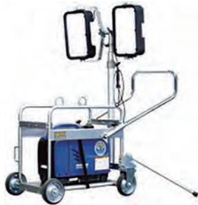
2灯式LED投光機(LED200W*2) (ガソリン)