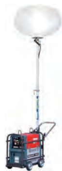
LEDバッテリー式 バルーン投光機