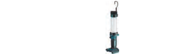
充電式LEDハンディーワークライト