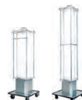
100V LEDパノラマスタンド (LED108W/95W)