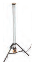
100Vポールアップライト