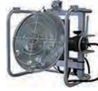
100V400Wハンディーナイター