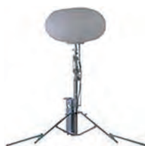
100V1000W三脚式 バルーンライト