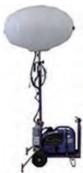
400Wバルーン投光機 (ガソリン)