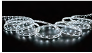
100VLED ロープジャックライト