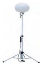
100V100W三脚式 バルーンライト