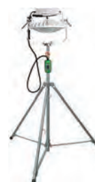
100V300Wディスクバルーン (LED)