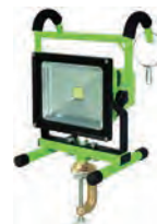
充電式30W LEDライト (ハンガーチャージライト)