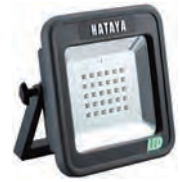
充電式LEDケイライト