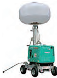
1000Wバルーン投光機 (軽油)