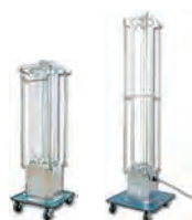
100Vパノラマスタンド (蛍光灯20W*4/40W*4)