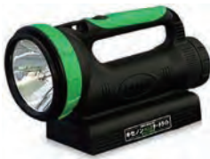
充電式HIDサーチライト