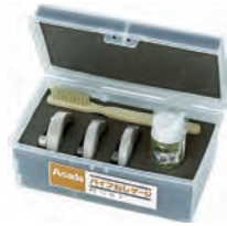
パイプねじゲージセット