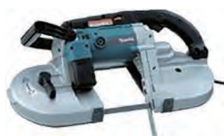
100Vハンドバンドソー