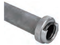
パイプねじゲージ