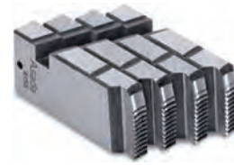
ねじ切機用刃物 (チェーザー)