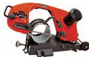
100Vバンドソー (チェンバイス)