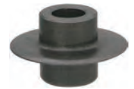
パイプカッター刃