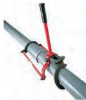
スーパーパイラー