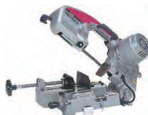
100Vバンドソー (平バイス)