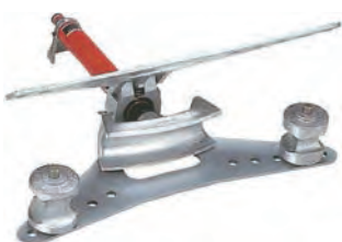
ガス管電線管用ベンダー