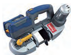
充電式ハンドバンドソー