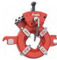
ダイヘッド (刃物取付台座)