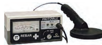
鉄筋探知機(シユアサーチ)