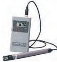
デジタル温湿度計