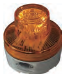
LED回転灯(マグネット式)