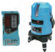
レーザー墨出し器