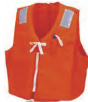
ライフジャケット