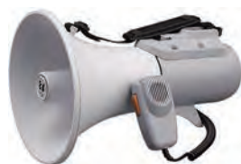
ショルダー式ハンドマイク