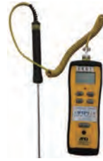
アスファルト温度計(デジタル)