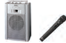
ワイヤレスアンプ