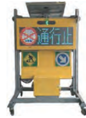
LEDソーラー電光表示板(昇降式)