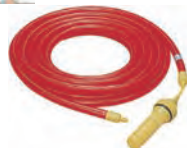
乾電池式チューブライト