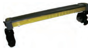
ソーラー式LEDフラッシュライト/ユニット