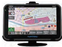
ポータブルカーナビ12V車用