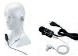
マイクロホンマイク