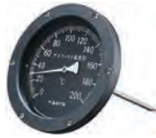
アスファルト温度計(アナログ)